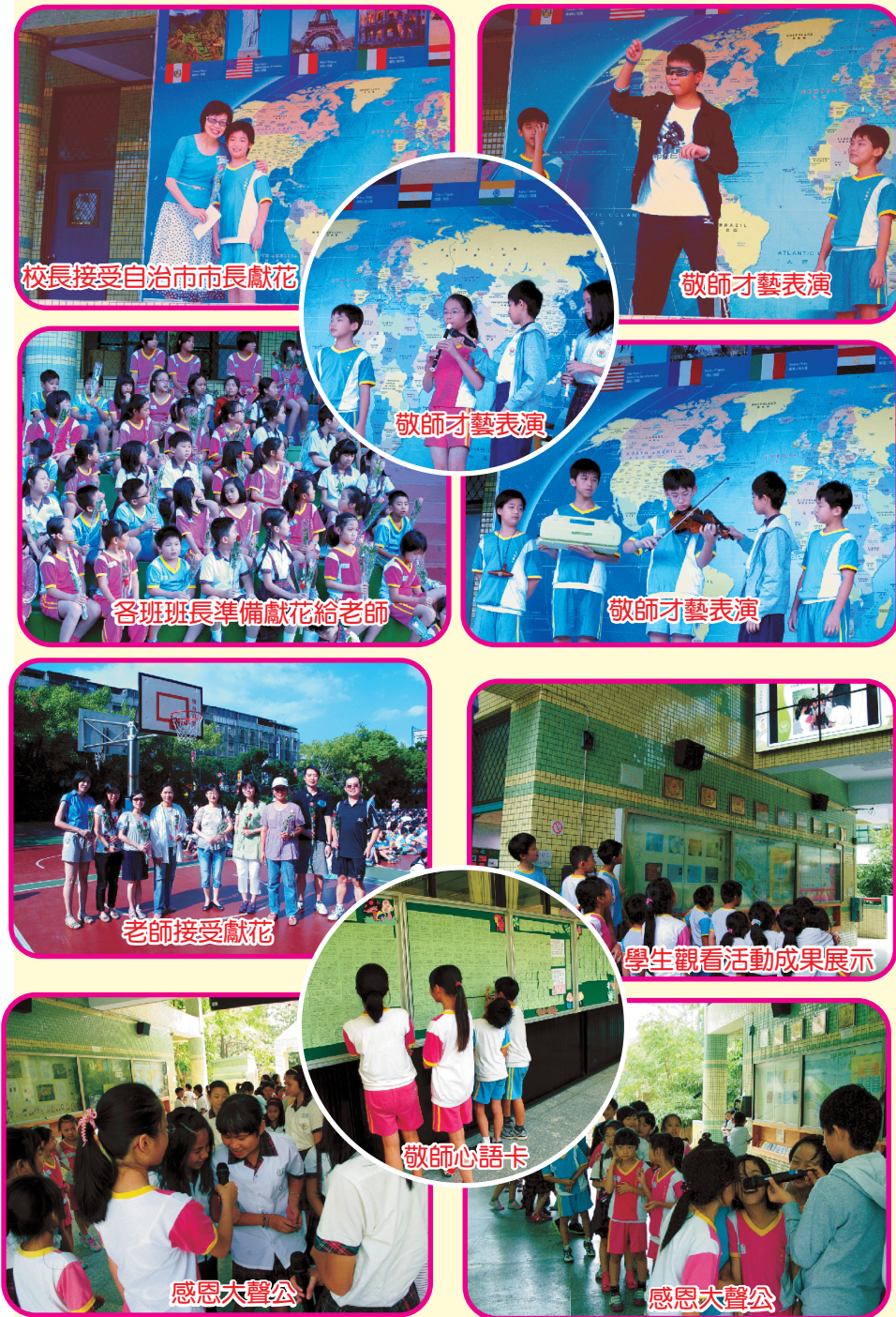
校長接受自治市市長獻花