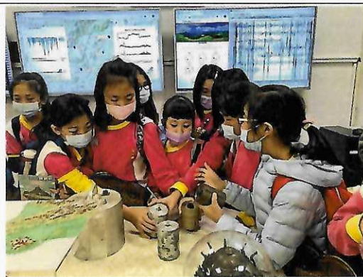
學生實際觀察地震相關測量工具