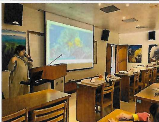
地質觀測中心解說大屯火山發展