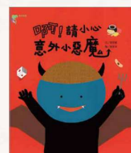
《啊！請小心意外小惡魔》