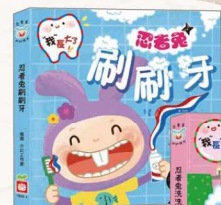
《我長大了：忍者兔刷牙》