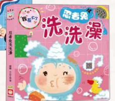
《我長大了：忍者兔洗澡》