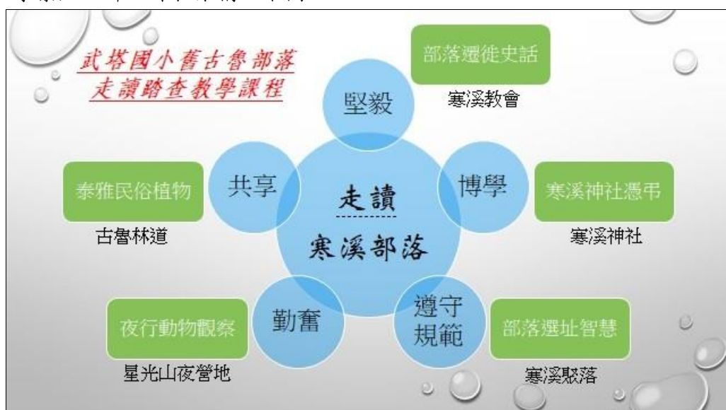
圖 ○ 走讀寒溪部落戶外教學課程架構圖

整體的教學設計以寒溪部落附近地區為場域，戶外教學活動共計五個教學景點，詳細課程架構如下圖。