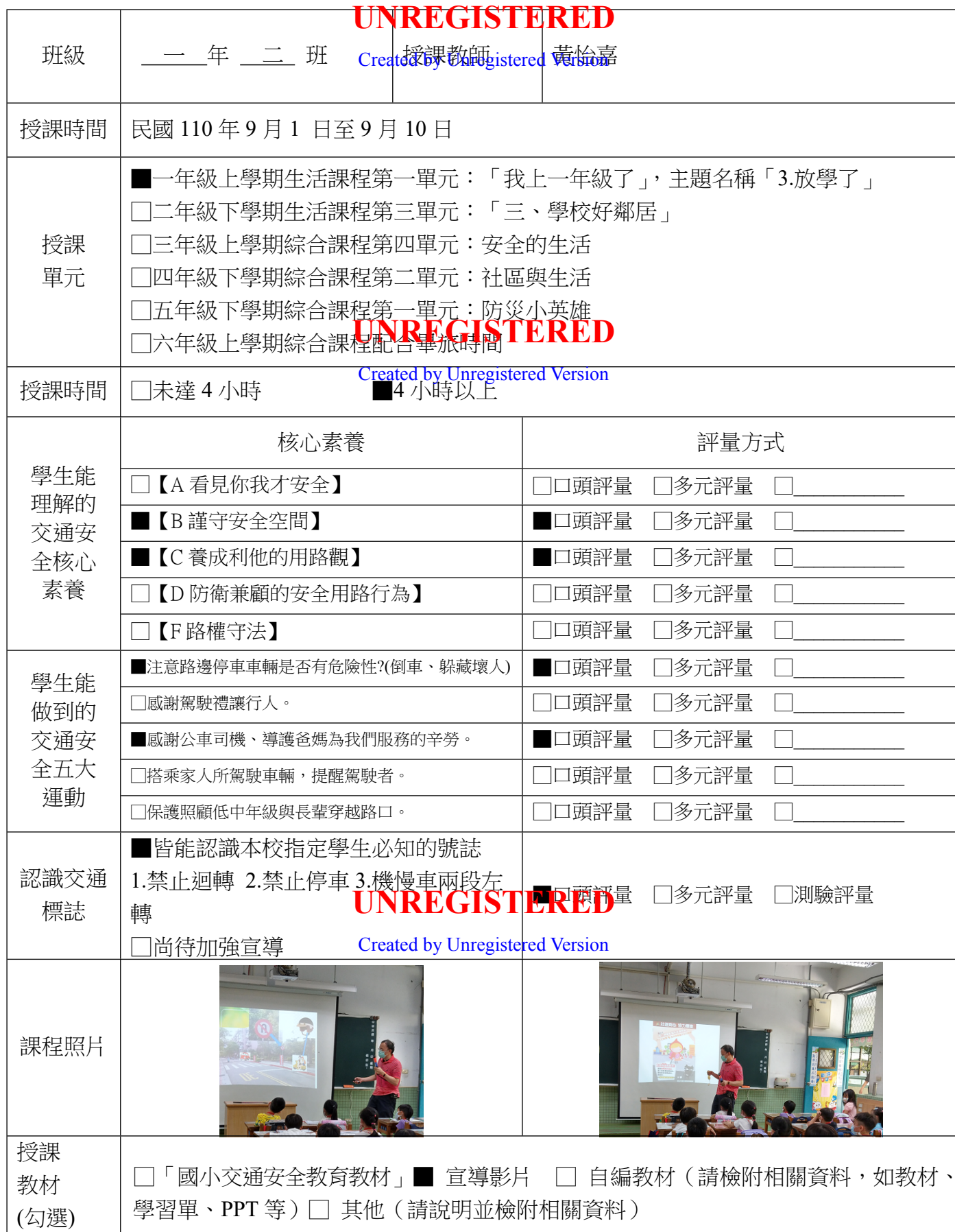
附件一 臺北市北投區文化國民小學「交通安全教育」課程實施檢核表